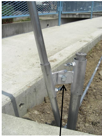
首振り式杭ガイドなので