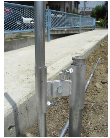
支柱たちが調節可能