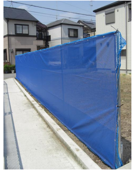
メッシュシート仕様 *注